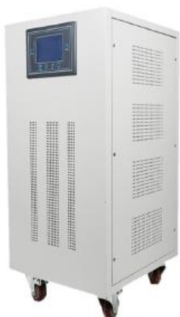
电源发生器 （局端机）