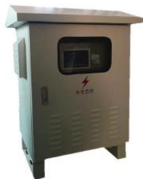
隔离转换器 （远端机）